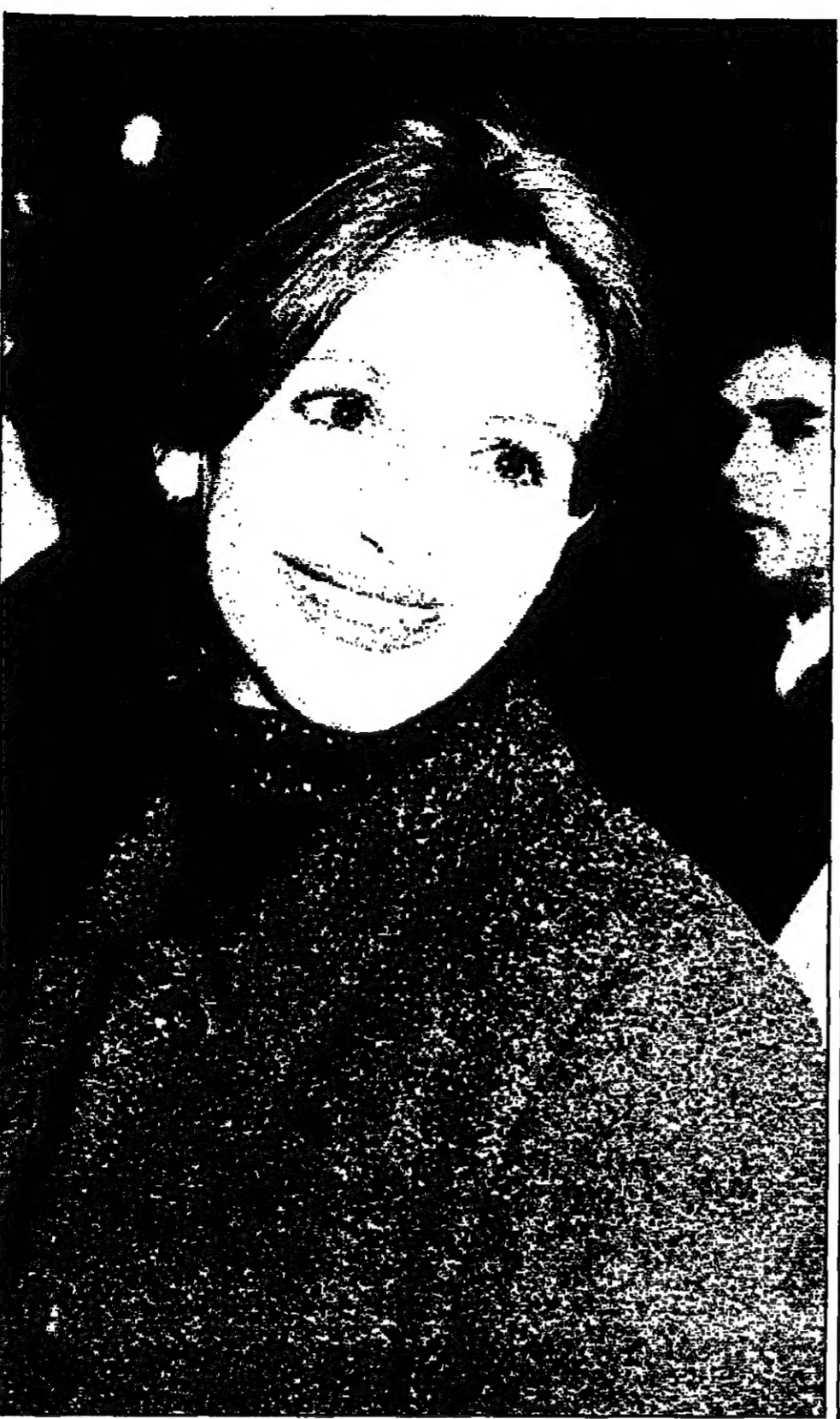
النجم الأمريكية جاويا روبرتس حضرت حفل العرض الاول لفيلم التساهل البيئوي الذي تقوم ببطولته فاي دونواي في لوس انجلوس امس الاول